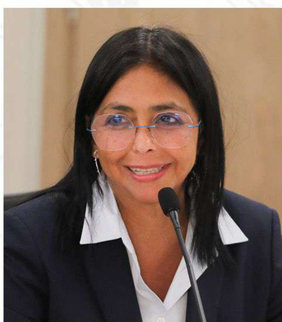
Delcy Rodríguez Presidenta