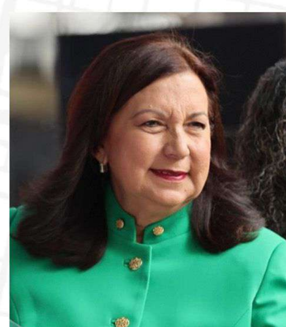
Carmen Meléndez Tercera Vicepresidenta